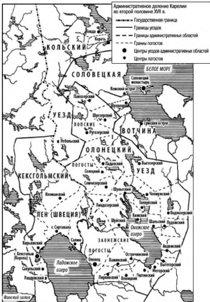
Карта 2. Административное деление Карелии во второй половине XVII в.